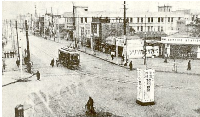
昭和5年ごろの国道1号線(旧国道)と沼津駅前通りが交差する付近。広い道の真ん中を路面電車が走っている