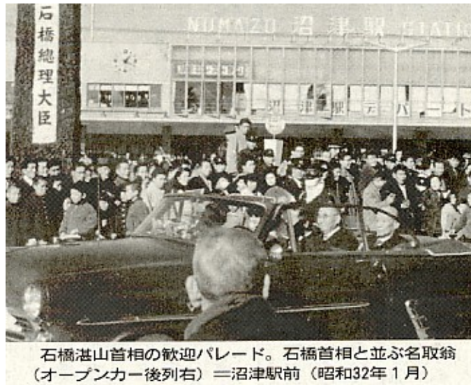
石橋湛山首相の歓迎パレード。石橋首相と並ぶ名取翁 (オープンカー後列右)＝沼津駅前(昭和32年1月)

先月七日、大正ロマン漂う木造建築、沼津市千本郷林の「沼津倶楽部」がレストランとして再オープンした。ここはかつて、県内選出代議士で唯一、首相となった石橋湛山を育てた「湛山会」の拠点の一つだった。