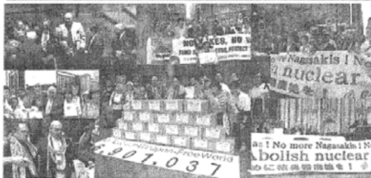
署名目録をNP再検討会議議長に手渡す高草木原水協事務局長、5月2日のニューヨーク行動、1万人を超えるパレードの様子、日本から国連に届けた署名の山、署名を受けるカバクテランNPT再検討会議議長とダブルテ上級国連上級代表の両氏、